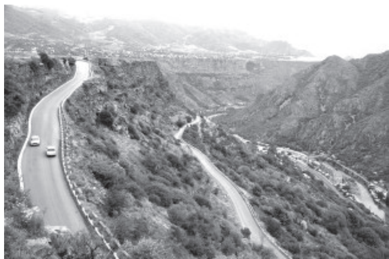
Истоки: Лорийское ущелье.

...А цвета в хохломской росписи? Ну почему всего три краски — главные? Красный цвет, к примеру, это красота, а значит, основа этого искусства. Чёрный цвет — земля, рождающая эту красоту. Золотой цвет — это цвет солнца, благополучия. А, кроме того, по словам Владимира Борисовича, любой другой цвет в печи бы потерялся, умер. И только киноархив на золоте становится от горячей обработки лишь краше.