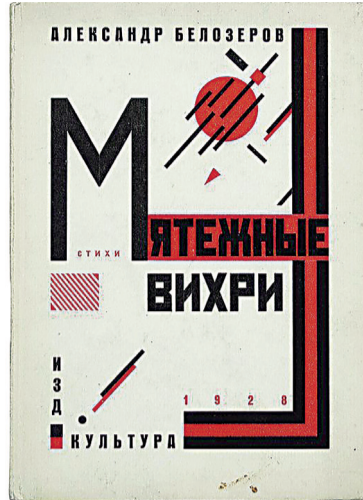
■ Книга «Мятежные вихри» была издана в 1928 году