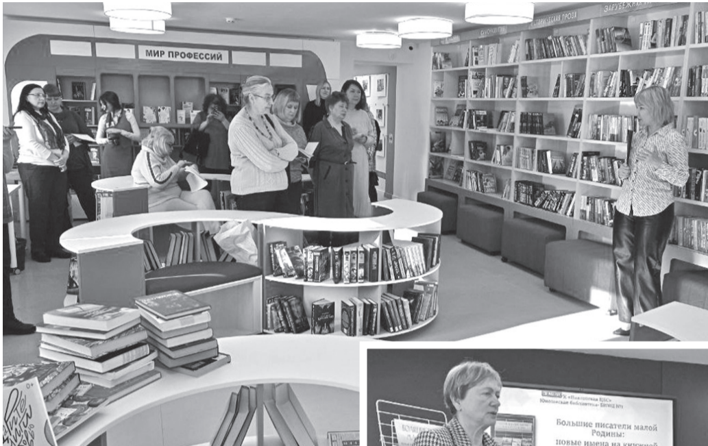
Юношеская библиотека в Павлово-на-Оке

О том, что группа «Рок-острова» имеет нижегородские корни, известно всем. А вот, что стихи к их песням пишет поэтесса из Павлово-на-Оке, корреспонденты «Дзержинских ведомостей» узнали во время литературно-краеведческой экспедиции «Большие писатели малой родины: новые имена на книжной полке россия». Она по традиции организована Нижегородским отделением Союза журналистов России при поддержке президентского фонда культурных инициатив.