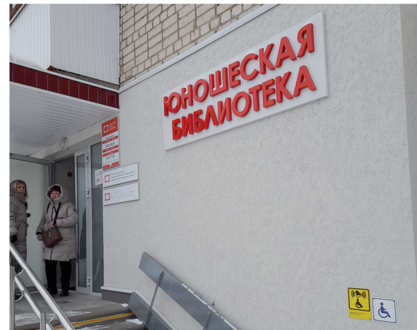
Юношеская – единственная в области

Поэтому всегда называли ее в народе юношеской, а десять лет назад закрепили это наименование официально. Когда обсуждали, какое направление в работе библиотеки будет приоритетным, решение пришло само – профориентация. – В Павлове, как и повсюду, остро стоит проблема оттока молодежи в крупные города,