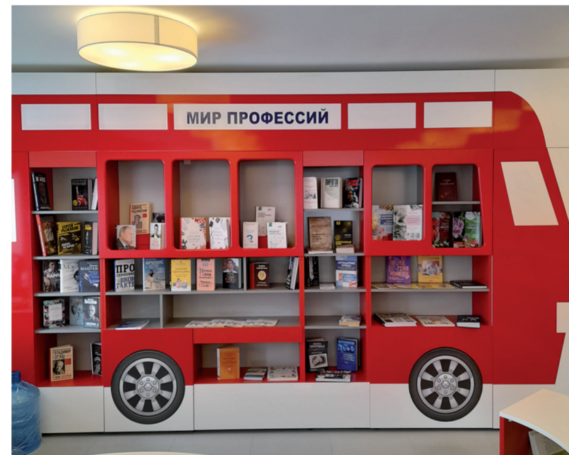
Одна из книжных полок – в виде «пазика»