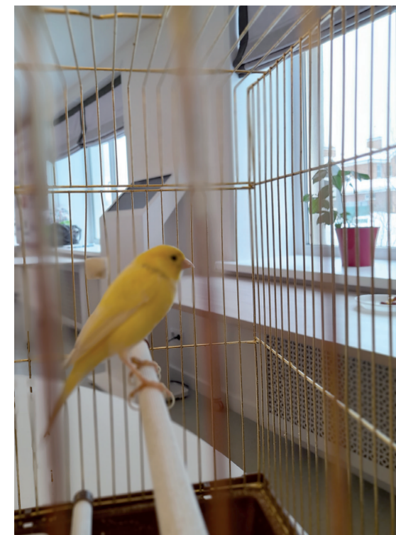
В библиотеке есть штатный певец – канарейка Герман. На окнах – лимоны

Из юношеской модельной библиотеки переместились в краеведческий музей. Он расположен на берегу Оки, в доме-усадьбе купца Гомулина постройки 1885 года. Экспозиция, развернутая на двух этажах, познакомит участников экспедиции с богатой историей промышленного города, с уникальными изделиями, сотворенными руками его умельцев. Испокон веков Павлово жило ремеслом, но у многих горела в душе творческая искорка. Хорошо, что огонек творчества в этом городе не гаснет.